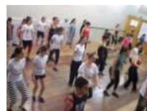
2ª edição – São Carlos (Jul/Ago 2010)