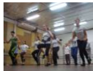
3ª edição – São Paulo (Janeiro 2011)