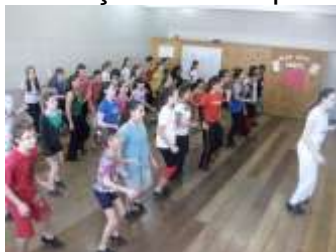
1ª edição – Araraquara (Junho 2010)